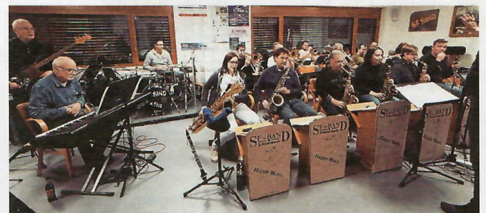
Volles Haus und höchste Konzentration bei der Probenarbeit für die Musik-Revue-Show „100 Jahre SF. Band Schwarzach“ zu der viele neue Musikstücke für die Erzählung der Vereinsgeschichte einstudiert werden

Jetzt kommt eine neue Aufgabe dazu, die etwas aus dem bisherigen Rahmen fällt und vor der er auch gehörigen Respekt hat. Respekt, nicht Angst, denn hinter der großen Aufgabe, eine anspruchsvolle Musik-Revue-Show zum großen Jubiläum mit einer schon auf höherem Niveau agierenden SF. Band in kurzer Zeit zu erarbeiten, steckt eine große Herausforderung. „Meine erste Erkenntnis war, dass hier eine ungewöhnlich engagierte Truppe mit hohem Einsatzwillen und Anspruch steckt und das ist genau die Aufgabe, die ich mir gewünscht habe!“, schildert Kible seinen ersten Eindruck, als er davon berichtet, dass alle Übungsstunden nicht von der Uhr, sondern vom jeweiligen Übungsstand beendet werden – begeistert, klaglos und ohne den geringsten Ansatz von mürrischer Stimmung, wenn der strenge Zeitplan wieder einmal die Proben verlängert. Allerdings sieht er bei einer derartigen Einstellung auch die dahinterstehende Forderung der Musiker an den Dirigenten: „Mach uns fit für die Jubiläumsgala! “ Ein weiterer Punkt, das Projektdirigat zu übernehmen, steckt in den Persönlichkeiten der Bandmitglieder, die ihm seit der ersten Probe frei, offen und herzlich entgegenzutreten und so eine hervorragende und stark animierende Arbeitsatmosphäre schaffen.